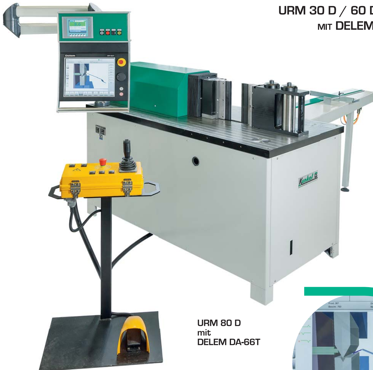
URM 80 D mit DELEM DA-66T